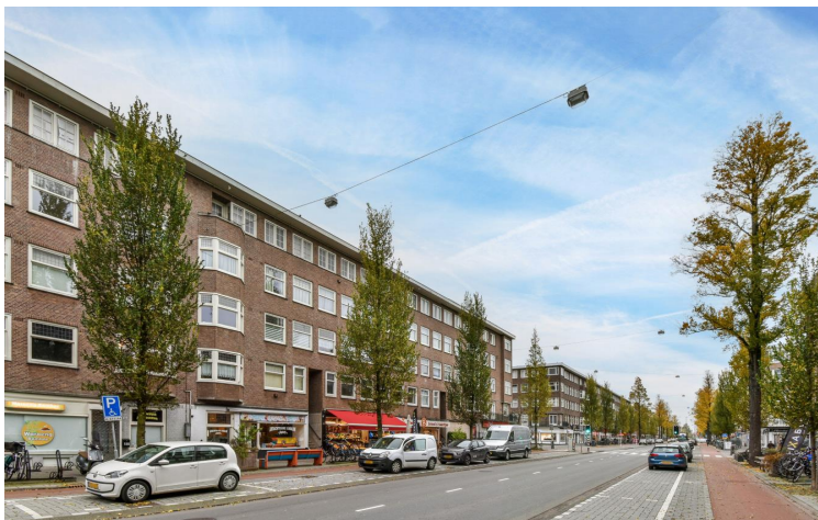
Rijnstraat 174 -176 te Amsterdam

Adres: Café Restaurant Dauphine aan het Prins Bernardplein 175 te Amsterdam